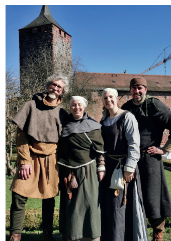
Kinderaktionen in Gewandung, hier: Burg Rothenfels

Am 1. Juni war das Team der Burglandschaft als ein Kooperationspartner des Geo-Naturparks auch beim diesjährigen UNESCO-Welterbetag in Lorsch mit einem Informationsstand und Aktionen vertreten. Das UNESCO-Welterbe Kloster Lorsch samt Förderverein, der UNESCO Global Geopark Bergstraße-Odenwald und die Stadt Lorsch veranstalten diesen Tag.