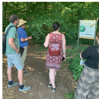
Exkursion HEIMAT DIGITAL REGIONAL 20.06.-22.06.2025

Das Förderprogramm HEIMAT DIGITAL REGIONAL geht mit unserem Burglandschafts-Projekt „(Digital) Wandelnde Kulturlandschaften Frankens“ in die finale Runde. Seit Januar 2023 engagierten sich die Mitarbeiter der Burglandschaft im Rahmen dieses Projekts zu verschiedenen Aspekten der regionalen Landschaftsbetrachtung und insbesondere in der digitalen Landschaftsrekonstruktion und Visualisierung. Auch fanden verschiedene Aktivitäten und Veranstaltungen, wie etwa auch eine Exkursion durch die fränkische Kulturlandschaft zwischen Untermain und Südwestspessart bis nach Neustadt bei Coburg statt. Das Projekt wurde dabei durch die Fördermaßnahme „HEIMAT DIGITAL REGIONAL“ des Bayerischen Staatsministeriums der Finanzen und für Heimat unterstützt.