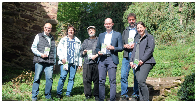
Präsentation des neuen Burgenführers zur Burg Dauchstein.

Im April 2025 war es so weit: Der neue Burgenführer zur Burg Dauchstein von Nicolai Knauer ist publiziert. Er ist gegen eine Schutzgebühr erhältlich. Des Weiteren wurden verschiedenste virtuelle Rekonstruktionen und auch sog. Haptische Modelle - dieses Mal auch von Schülern im Rahmen des Erasmusprojekts - von der Burg Breuberg und der Burg Carlow erstellt. Mehr dazu können Sie dazu in diesem Herold lesen.