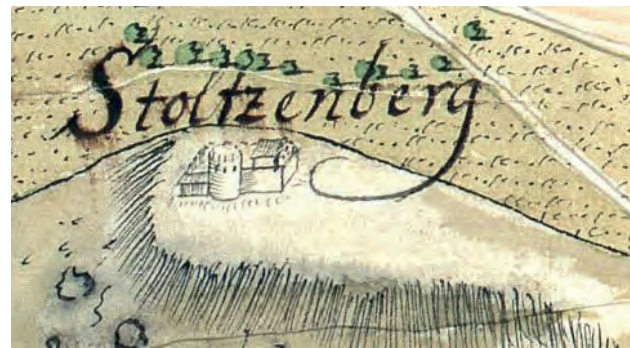
Die Ansicht der Burg Stolzenberg in einer Karte von 1752 zeigt die Wehranlage mit ihren wohl noch vorhandenen Baulichkeiten.