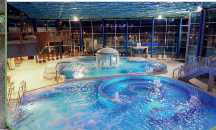
Die Spessart Therme seit 2005.

Die Wiederentdeckung der Solequellen Ende des 19. Jahrhunderts gab Anlass zur Gründung des Heilbades. Seit 1928 darf Soden das Prädikat „Bad“ führen. Während der Gebietsreform 1974 entstand schließlich die Stadt Bad Soden-Salmünster. Herzstück des staatlich anerkannten Sole-Heilbades ist heute die Spessart Therme. Hier finden die außergewöhnlich starken eisen- und mineralhaltigen Solequellen in der Thermalsole-Badelandschaft, in den balneologischen Therapien sowie für Sole-Wellnessangebote vielfältige Anwendungen zum Wohle der Gesundheit.