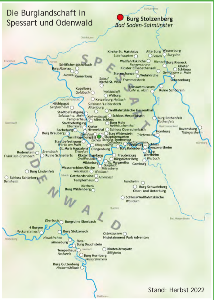
Stand: Herbst 2022