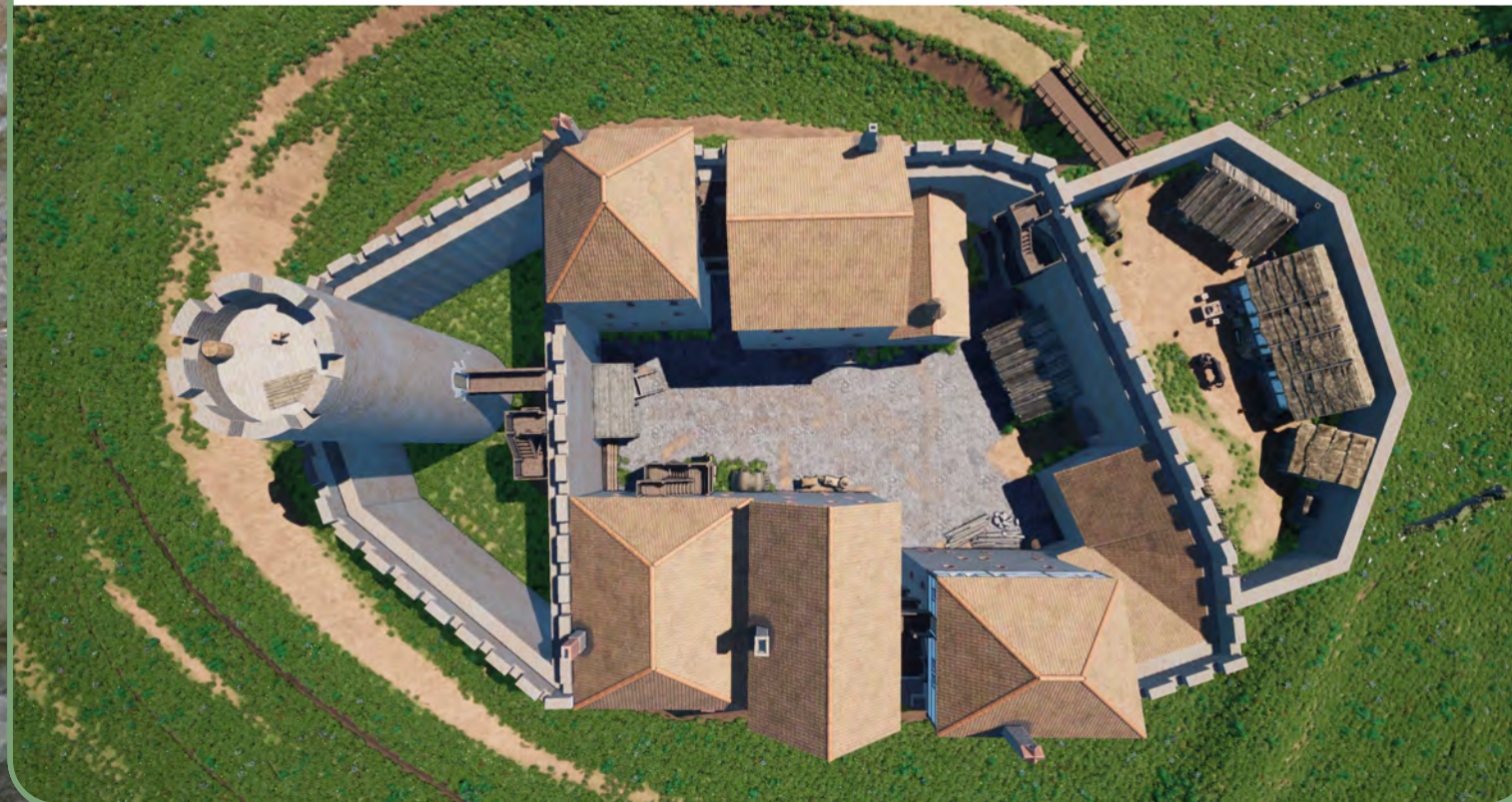
Die rekonstruierte Burg Stolzenberg in der Aufsicht. Rekonstruktion und Foto: Burglandschaft

Nördlich der Burg befanden sich vermutlich Vorburggebäude in Leichtbauweise aus Holz oder Fachwerk, wie der sehr weit außerhalb der Burg befindliche Halsgraben vermuten lässt. Eine äußere Ringmauer mit runden Flankierungstürmen zur Verteidigung mit Feuerwaffen wurde auf dem Stolzenberg nach dem optischen Befund dagegen niemals angelegt. Der fortifikatorische Wert der Burg kann nach 1400 deshalb nicht besonders hoch gewesen sein. Südlich der Burg gibt es geringe Geländespuren, mit dem Auge kaum erkennbar, die als Anschlüsse der Ummauerung der geplanten Stadt „Stolzenthal“ interpretiert werden können. Näheres lässt sich darüber erst nach einer Ausgrabung sagen. Kurz nach 1800 war der Baubestand bereits auf die noch heute vorhandene Bausubstanz reduziert.