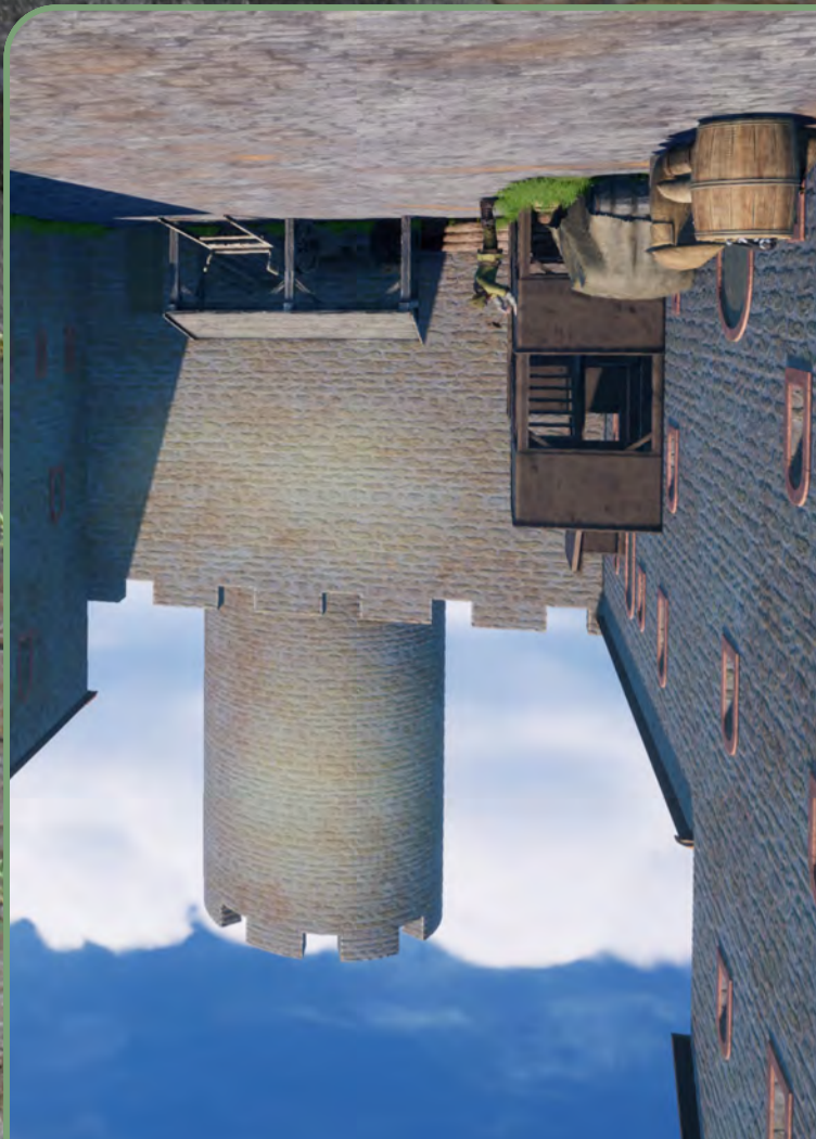
Der Bergfried aus der Perspektive des Burghofes heute (links) und um 1300 (rechts). Rekonstruktion und Foto: Burglandschaft

Die runde Bergfried mit seinem talwärtsgerichteten Eingang in circa 10 Metern Höhe ist das bedeutendste Bauwerk der Burg Stolzenberg, das heute noch erhalten ist. Wenn auch nicht in der ursprünglichen Höhe. Beim Besuch der Burg fragen sich sicherlich viele Besucherinnen und Besucher, wie denn die Burg ursprünglich aussah. Die zahlreichen Mauerreste und das weitläufige Gelände machen etwas neugierig und lassen weitere Bauwerke zur Befestigung und für Wohn- und Wirtschaftszwecke vermuten. Eine virtuelle Rekonstruktion, digital erstellt mit modernen Computeranimationen, kann dem Vorstellungsvorgang der Burgintressierten auf die Sprünge helfen. Wenn auch gerade in der auftragenden Bausubstanz eine kritische Betrachtung angesagt ist, kann eine Rekonstruktion die ehemalige Burganlage anschaulich visualisieren. Die Burg Stolzenberg wurde im Zustand des 14. Jahrhunderts rekonstruiert.