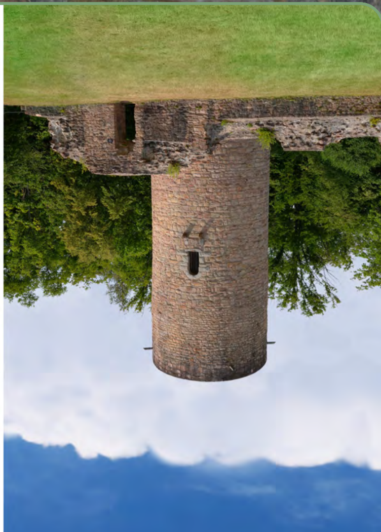
Der Bergfried aus der Perspektive des Burghofes heute (links) und um 1300 (rechts). Rekonstruktion und Foto: Burglandschaft

Die runde Bergfried mit seinem talwärtsgerichteten Eingang in circa 10 Metern Höhe ist das bedeutendste Bauwerk der Burg Stolzenberg, das heute noch erhalten ist. Wenn auch nicht in der ursprünglichen Höhe. Beim Besuch der Burg fragen sich sicherlich viele Besucherinnen und Besucher, wie denn die Burg ursprünglich aussah. Die zahlreichen Mauerreste und das weitläufige Gelände machen etwas neugierig und lassen weitere Bauwerke zur Befestigung und für Wohn- und Wirtschaftszwecke vermuten. Eine virtuelle Rekonstruktion, digital erstellt mit modernen Computeranimationen, kann dem Vorstellungsvorgang der Burgintressierten auf die Sprünge helfen. Wenn auch gerade in der auftragenden Bausubstanz eine kritische Betrachtung angesagt ist, kann eine Rekonstruktion die ehemalige Burganlage anschaulich visualisieren. Die Burg Stolzenberg wurde im Zustand des 14. Jahrhunderts rekonstruiert.