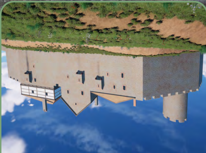
View of the reconstructed Stolzenberg Castle from the Salt Valley. Reconstruction and photo: Burglandschaft

The village of Soden was first mentioned by name in 1190. A castle complex already existed at the beginning of the 13th century, for in 1252 King Wilhelm authorized Abbot Heinrich of Fulda to rebuild the destroyed Stolzenberg Castle. In 1299, an official named Hermannus von Hutten is mentioned for the first time in connection with the castle. Finally, in 1375, the castle is mortgaged to the Hutten dynasty. In 1447 Ludwig von Hutten was knighted and received parts of the salt mines and the castle. In 1536, Lukas von Hutten and his wife Apollonia von Frankenstein had a castle built below the castle, which was further extended in 1594. When they moved to the castle, the castle lost its importance. The tower was renovated in the 1970s and reopened to the public.