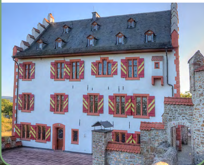
Das restaurierte Huttenschloss in Bad Soden-Salmünster.

Nach Aussterben der Seitenlinie von Hutten im Jahre 1819 wechselten die Besitzverhältnisse mehrfach. Zunächst erwarb Jean Pierre Dupré, ein Holzhändler aus der Rheinpfalz, das Schloss. Im Jahr 1875 errichtete Georg Vitriarius, der die Nutzungsrechte über die wieder erschlossenen Solequellen der Stadt besaß, eine erste private Badeanstalt im Souterrain des Schlosses. Dafür wurde das salzhaltige Heilwasser in Holzfässern von den Quellen bis zum Schloss transportiert. Im Jahre 1901 wurde das Schloss von dem Garnfabrikanten Adolf Krafft aus Offenbach erworben. Dieser modernisierte es, baute es als Sommerresidenz für seine Familie um und ergänzte es durch einen englischen Landschaftspark.