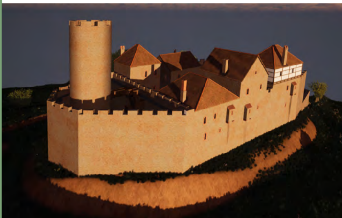
Oben: Die Burg Stolzenberg in der Abendsonne (Ansicht von Nordwesten), unten: Die Burg Stolzenberg bei einem Gewitterregen (Ansicht von Osten). Rekonstruktionen und Fotos: Burglandschaft