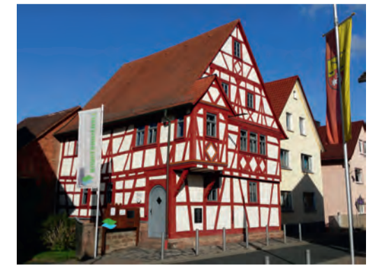
Das BIB im historischen Rathaus in Eschau.

Auf Initiative des Unterfränkischen Instituts für Kulturlandschaftsforschung an der Universität Würzburg – Archäologisches Spessart-Projekt e.V. (ASP) im Jahr 2011 gegründet, ist das Netzwerk als "Burglandschaft e.V." seit 2017 ein gemeinnütziger Verein. Vom Bildungs- und Informationszentrum Burglandschaft (BIB) in Eschau aus wird die überregionale Zusammenarbeit koordiniert. Ziel ist die gemeinschaftliche Inwertsetzung und Bewerbung historisch bedeutender Profan- und Sakralbauten.