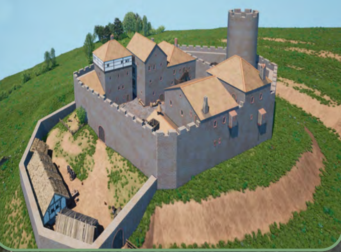
Ansicht der rekonstruierten Burg Stolzenberg von Südosten.