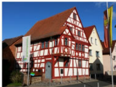
Das BIB im historischen Rathaus in Eschau.

Auf Initiative des Archäologischen Spessartprojekts (ASP) im Jahr 2011 gegründet, ist das Netzwerk als "Burglandschaft e.V." seit 2017 ein gemeinnütziger Verein. Vom Bildungs- und Informationszentrum Burglandschaft (BIB) in Eschau aus wird die überregionale Zusammenarbeit koordiniert. Ziel ist die gemeinschaftliche Inwertsetzung und Bewerbung historisch bedeutender Profan- und Sakralbauten.