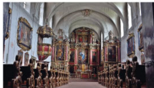
Blick vom Langhaus auf den Hochaltar (Kilian Stauffer, 1706), Foto: Rolf Baron

Fotos Titelseite: Titelbild: Rolf Baron, Kopfzeile: Gerhard Köhler