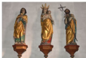
Figurengruppe im Mönchschor.

Eine Besonderheit bildet die schmuckvolle Innenausstattung aus dem 18. Jahrhundert, darunter Stuckmarmoraltäre von Kilian Stauffer und Werke von Georg Sebastian Urlaub, wie etwa dessen Wandgemälde aus dem Leben Jesu und des Kreuzwegs. In den beiden Seitenaltären sind seit 1704 die Reliquien der Heiligen Viktor und Antonin beigesetzt, was für eine Belebung der Wallfahrt des Klosters sorgte. Daneben ist eine römische Grabinschrift angebracht. Von der ursprünglichen Klosteranlage ist nur wenig erhalten geblieben, wie etwa der Mönchschor mit gotischem Kreuzrippengewölbe. Er ist mit einem barockem Chorgestühl und einer Figurengruppe aus der Werkstatt Tilman Riemenschneiders ausgestattet.