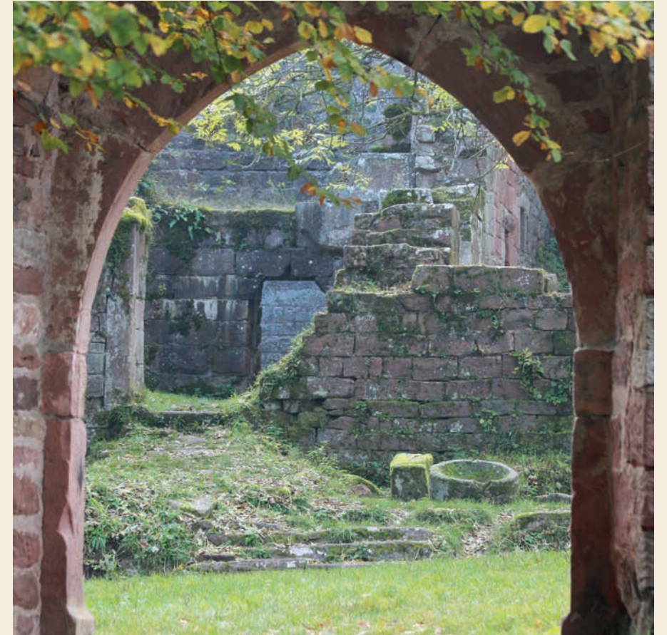
Blick in den ersten Hof

Ein Erdbeben im Jahr 1356 soll die Burg stark beschädigt haben. Im 15. Jahrhundert errichtete Erzbischof Dietrich von Erbach die große