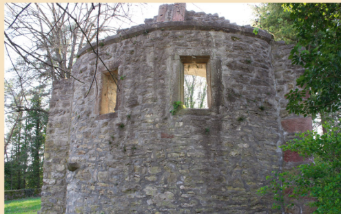
Die Kirche am Arcoplatz diente dem Ort lange als Pfarrkirche und Kapelle des alten Friedhofs in ihrem Umfeld.

Anschließend durchqueren Sie den ehemaligen Schlossgarten, welcher im Bereich von Klosterkreuzgang und -garten angelegt worden ist. Die nächste Tafel informiert über die Grafen zu Leiningen-Billigheim und deren Schloss aus dem 19. Jahrhundert. Dieses ist 1902 einem Brand zum Opfer gefallen und abgerissen worden.