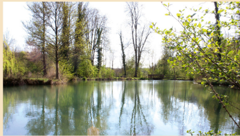
Der idyllische Schlosspark lädt zum Flanieren ein.

Vom Parkplatz an der Schefflenz erreichen Sie nach wenigen Metern die Infotafel zum Zisterzienserinnenkloster, das vom 13. bis zum 16. Jahrhundert hier bestand. Auf dem weiteren Weg lohnt es sich, über die Parkschleife den Teich im Schlosspark zu umrunden.