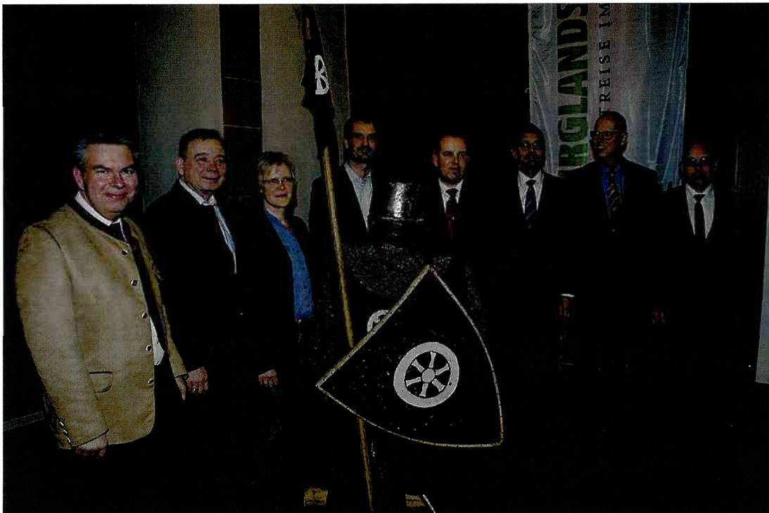
Der gewählte Vorstand