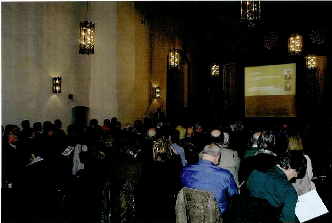
Die Gründungsversammlung

Im Bildungs- und Informationszentrum Burglandschaft (BIB)